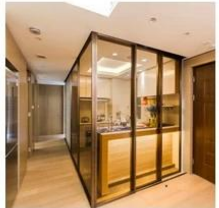
Embalaje de vidrio tintado de seguridad por JIMY GLASS: