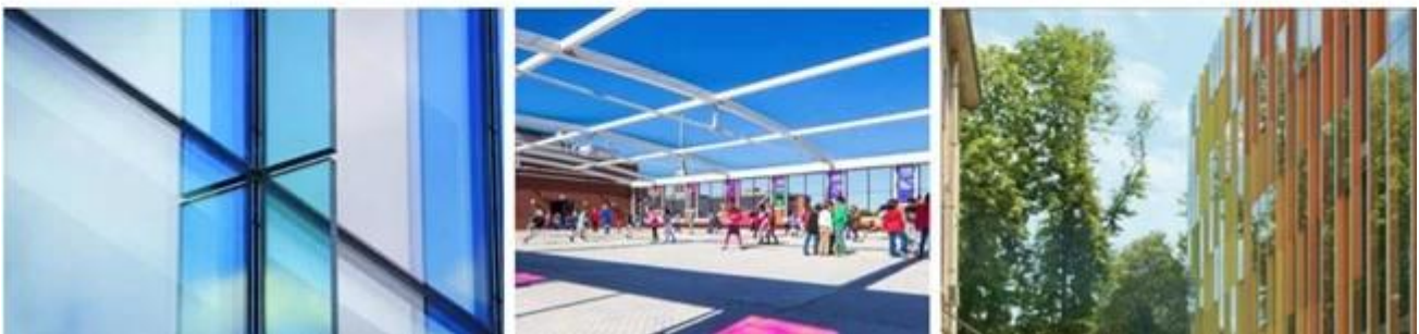
vidrio templado de gran tamaño utilizado en aletas de pared de vidrio