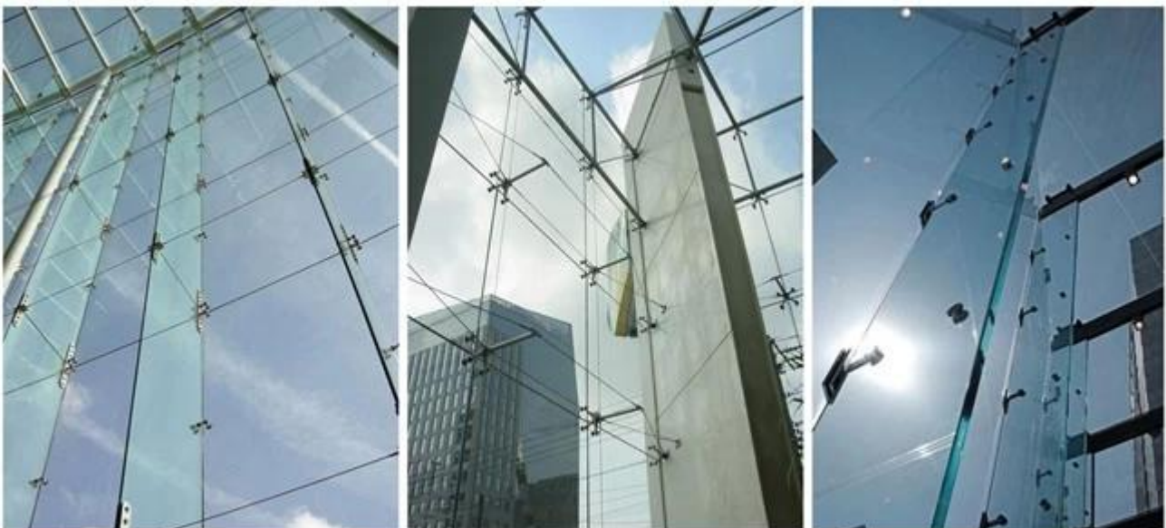
Aletas de pared de partición de vidrio de tamaño gigante