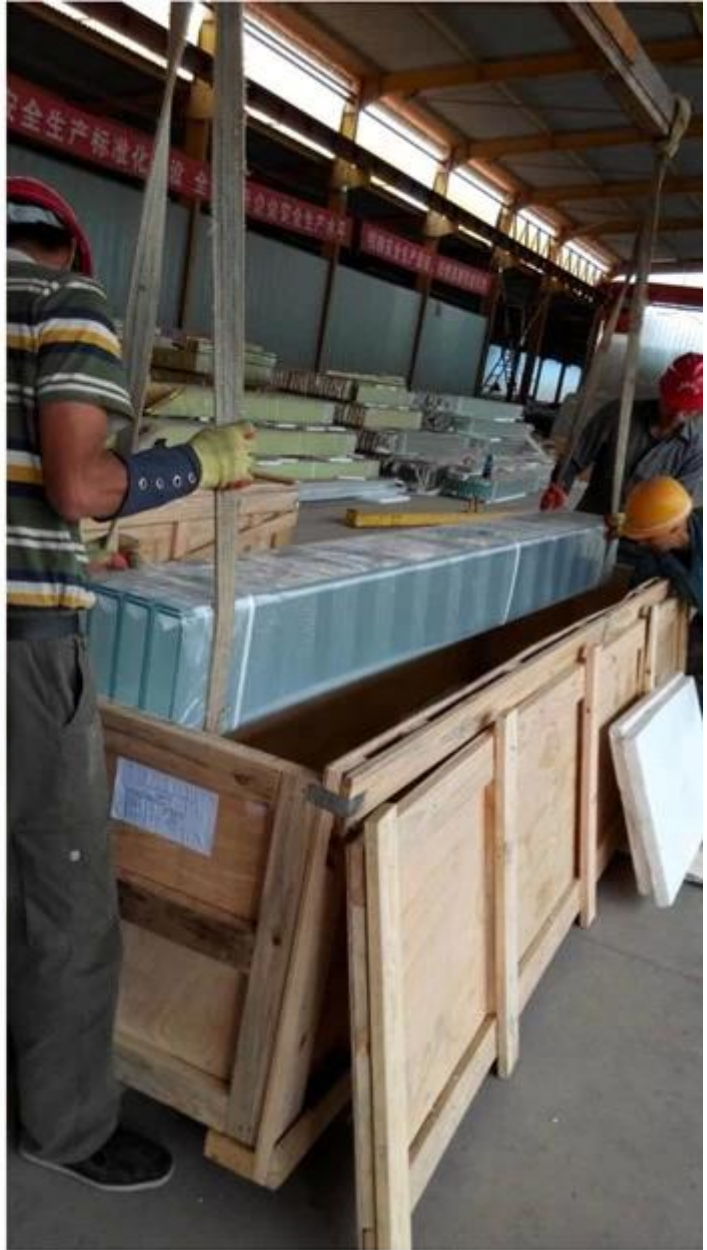
Aplicación de vidrio de perfil bajo U de 10 mm de hierro