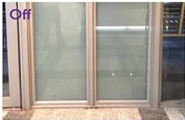
Vidrio de película cambiabile de pdlc inteligente usado para sala de reuniones