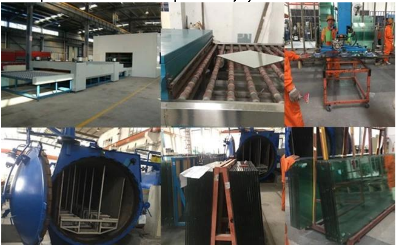
Las aplicaciones del vidrio de seguridad laminado de 15 + 15 mm