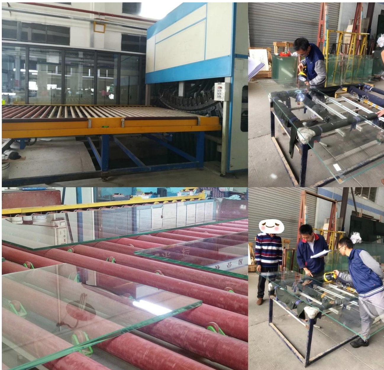
4. Nuevas cajas fuertes de madera contrachapada con corchos separados de vidrio templado de bajo contenido en hierro de 12 mm.