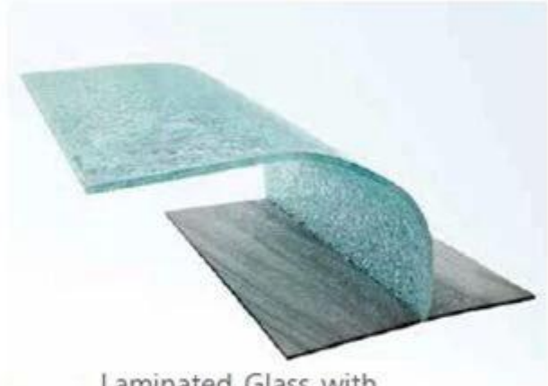
Laminated Glass with PVB Interlayer