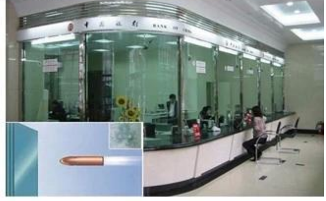
Jimmy Glass yrityksen pakattu huolellisesti