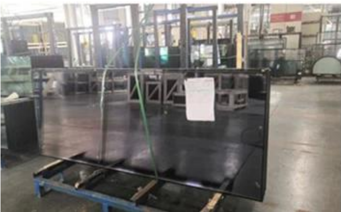
Eristetty lasi vahva pakkaus ja lastaus