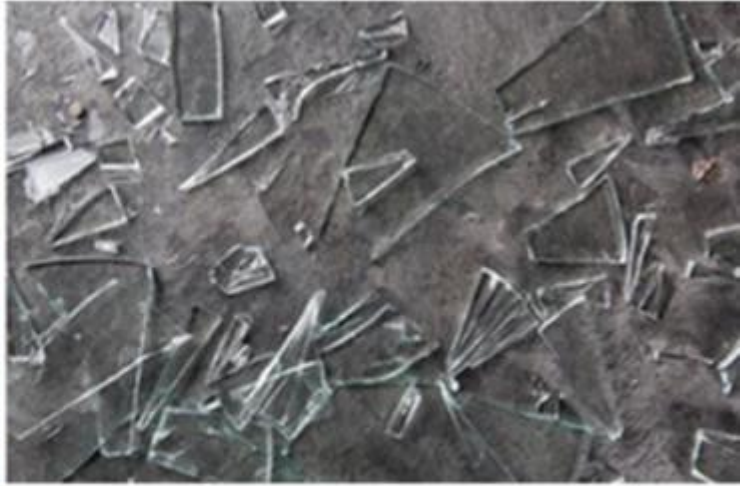
Annealed Glass when broken into sharp, easy to hurt human