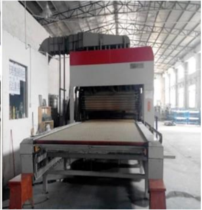
Karkaistu laminoitu turvalasi vahvempi, pakkaus ja lastaus