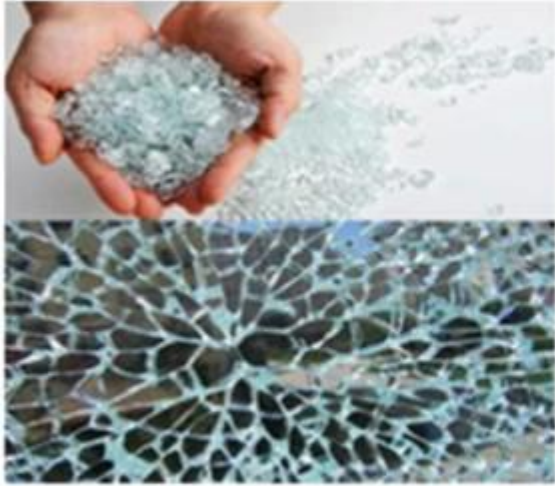
Toughened Glass broken into alveolate granules is human harmless