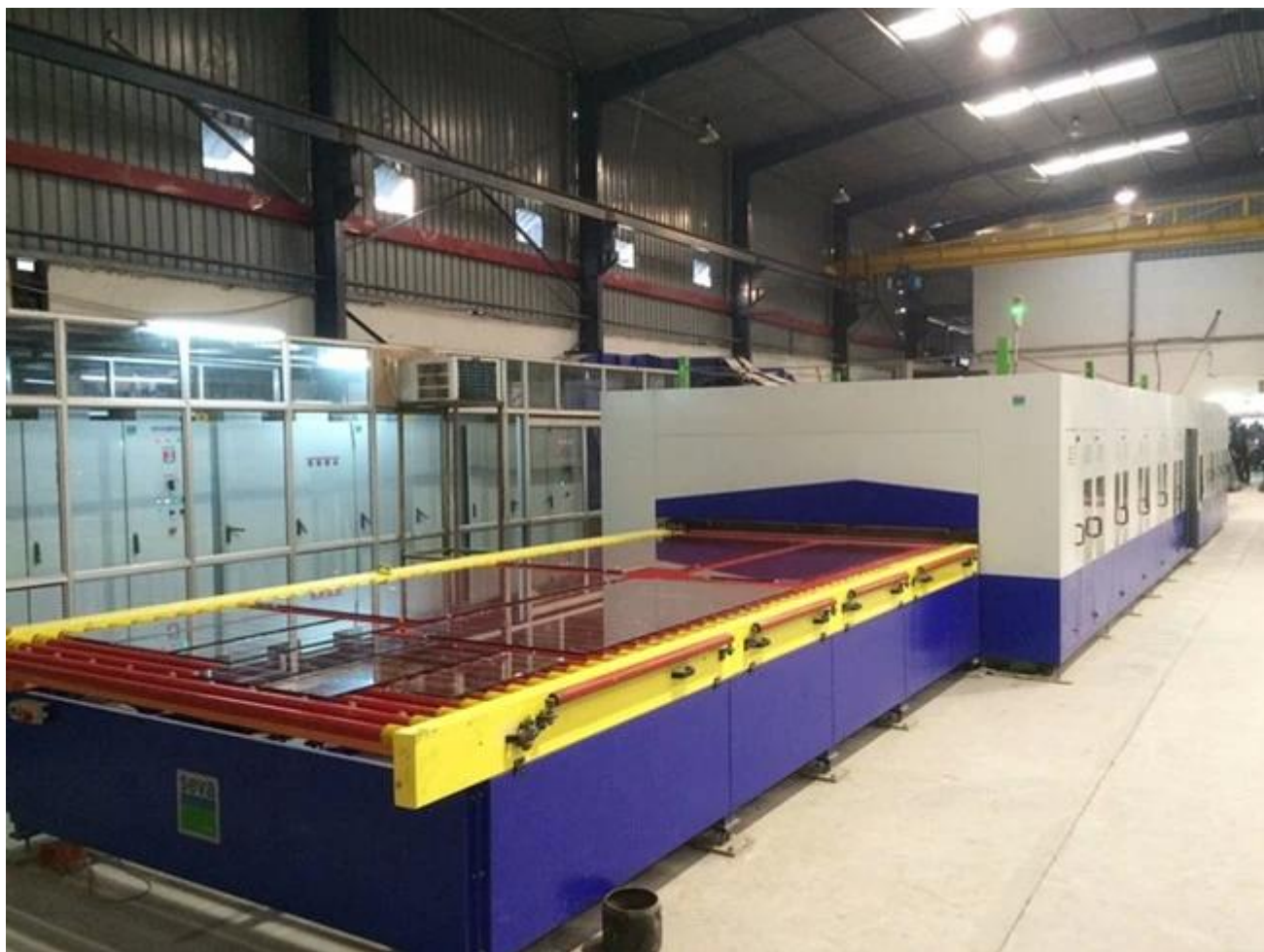
Karkaistua lasia turvallisuuden pakkaus