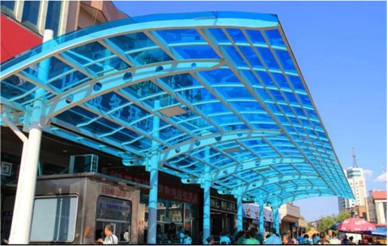
17.52mm vihreä värillinen karkaistu laminoitu lasi Parveke