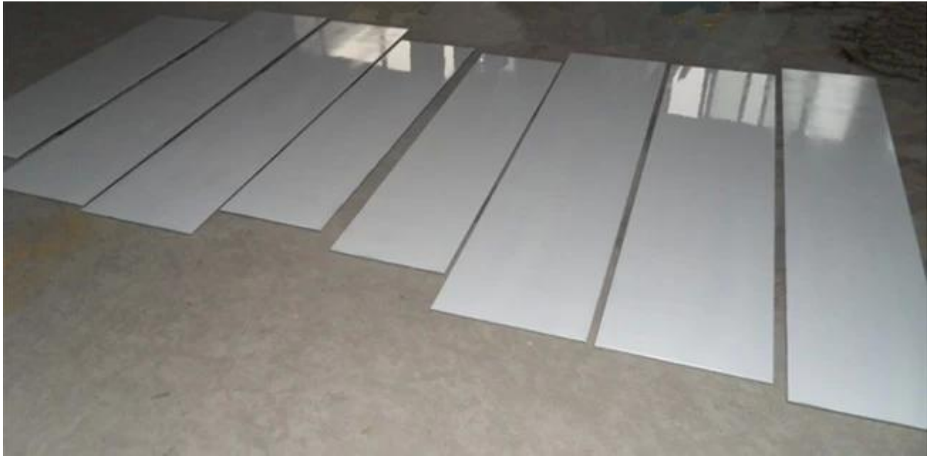
Eriväristä Lakka lasi: