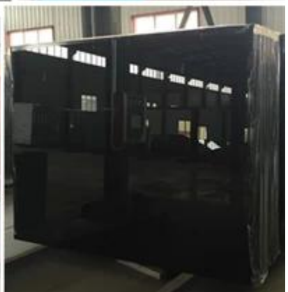
Lakka lasin tuotannossa ja varasto: