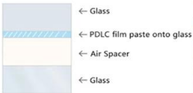
switchable IGU option A