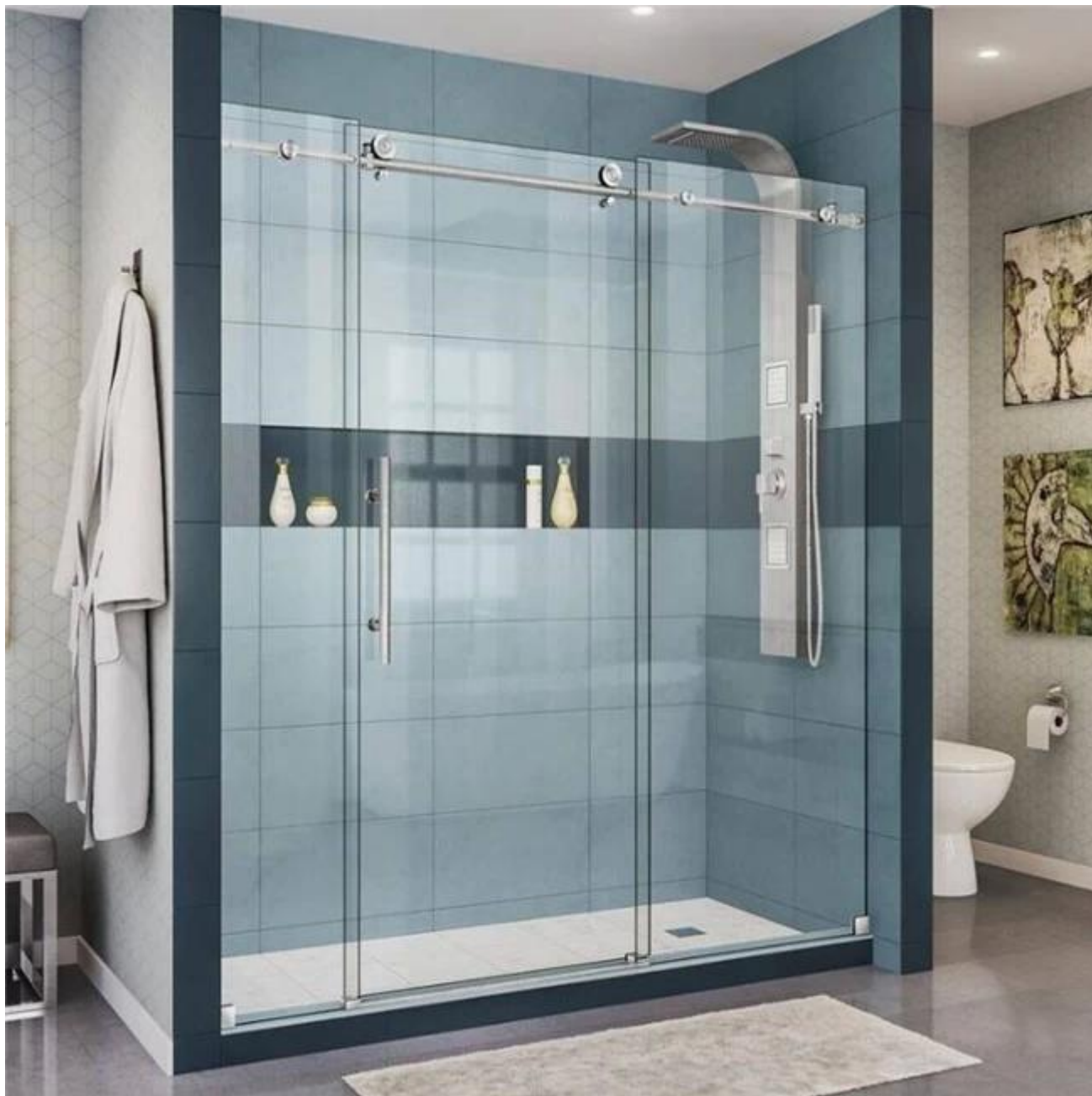
10 mm paksu kirkas karkaistu lasi suihku