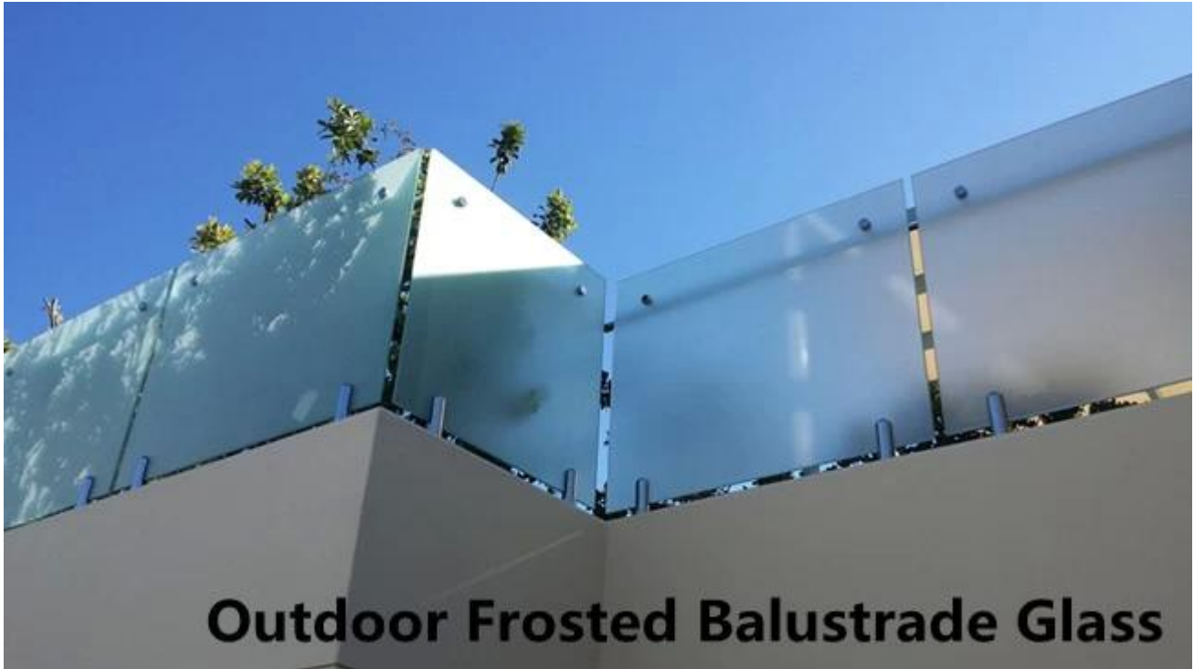
Outdoor Frosted Balustrade Glass