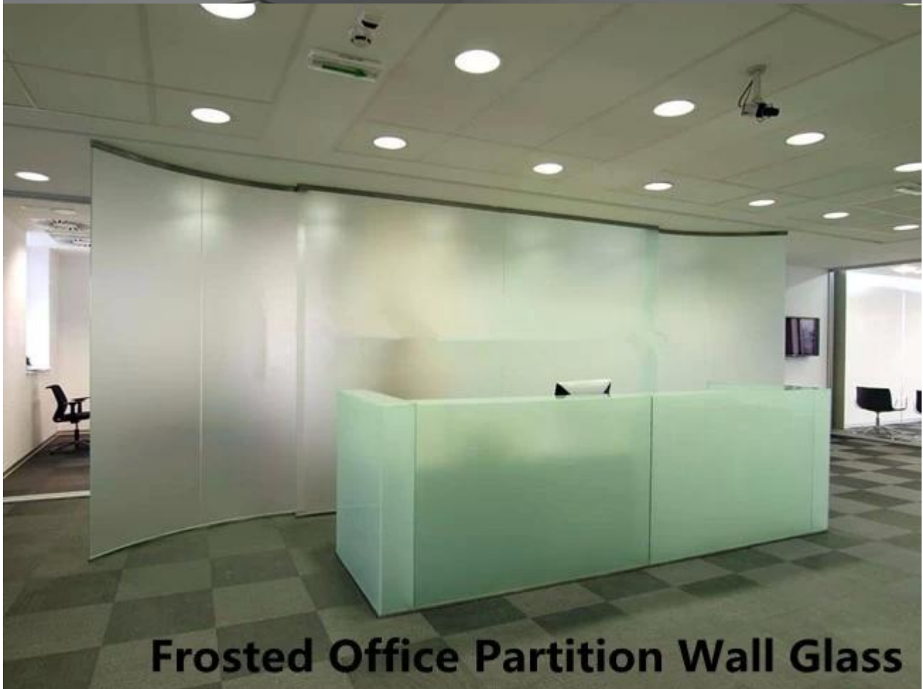
Frosted Office Partition Wall Glass