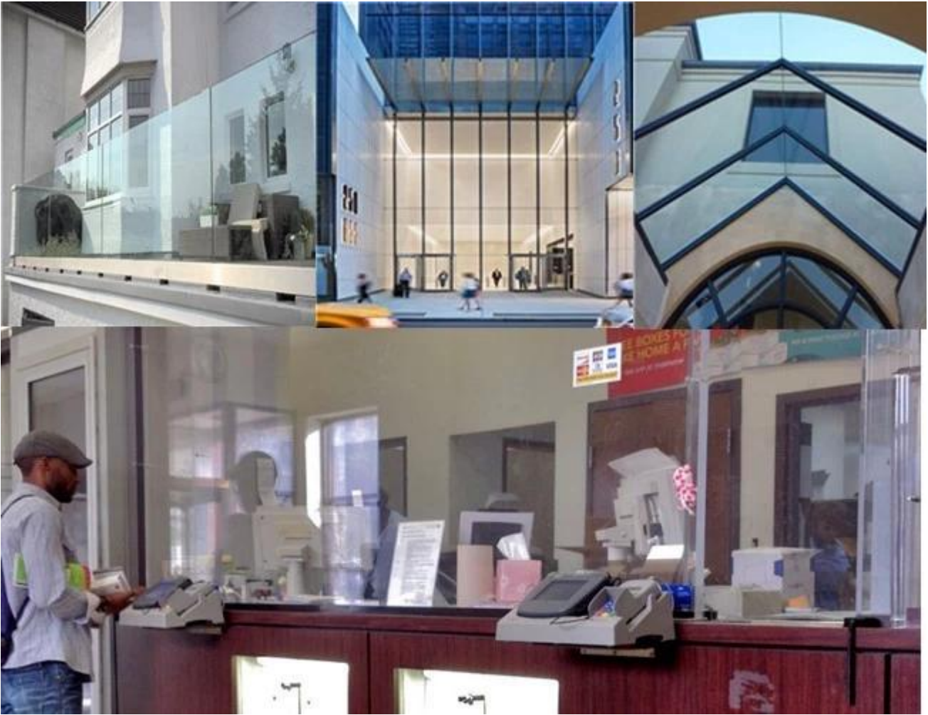
Pakkaus 553 kirkaasta HS-laminoidusta lasista