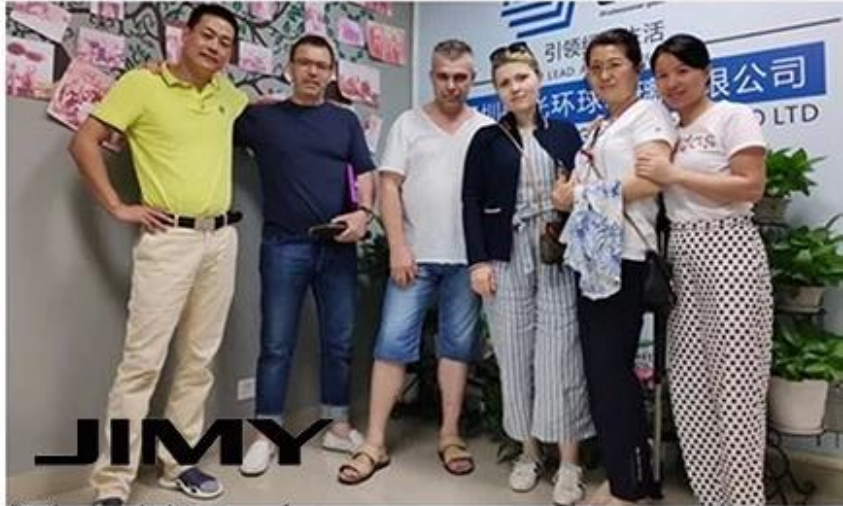
JIMMY Professional glass manufacturer