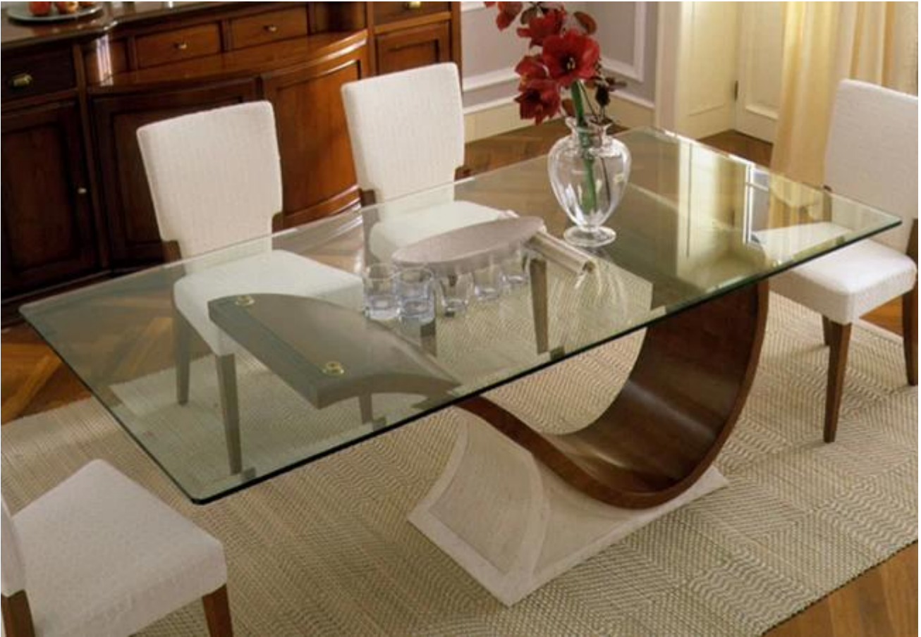
Ligne de produits: