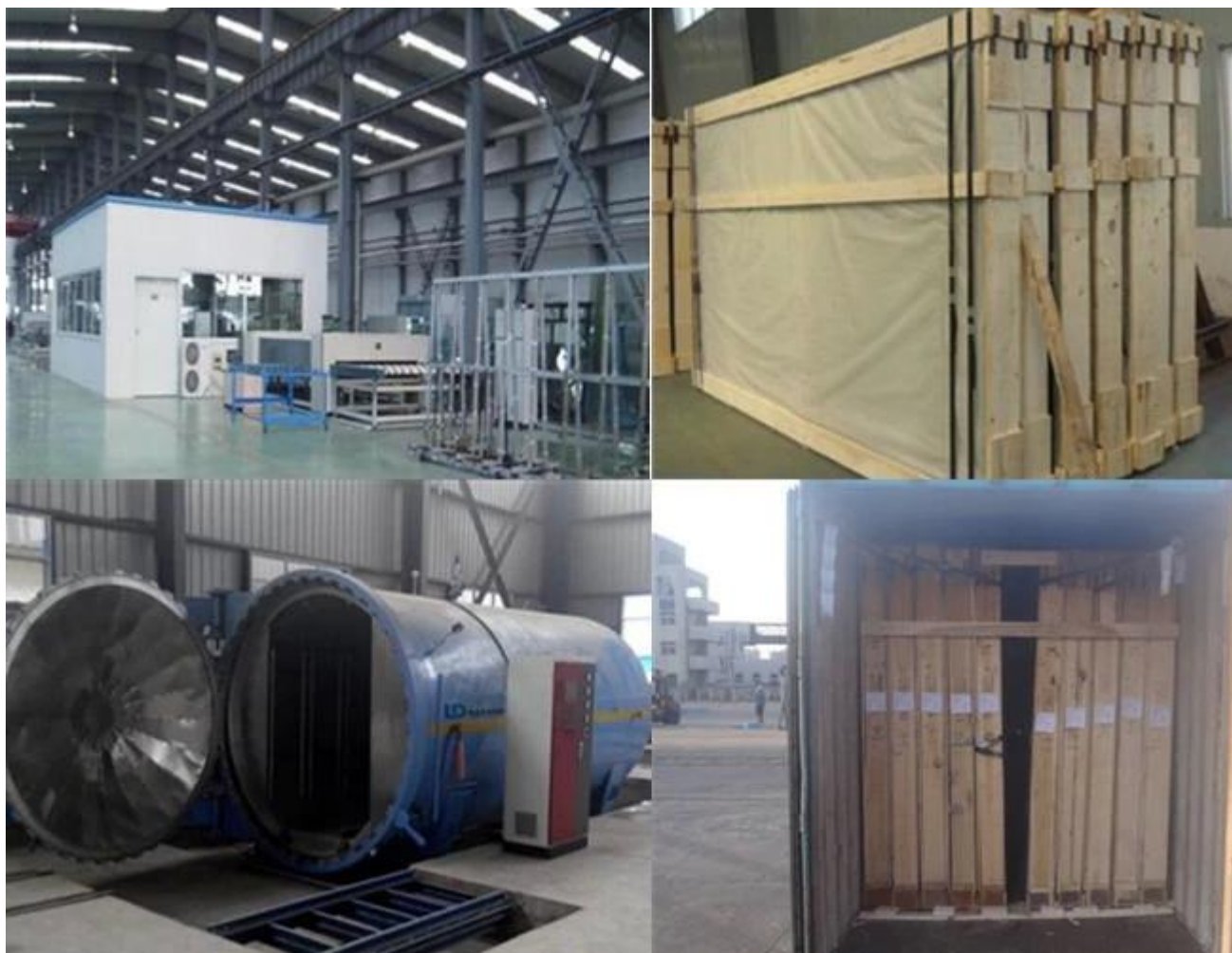
Applications de verre flotté laminé Bronze de 8,38 mm