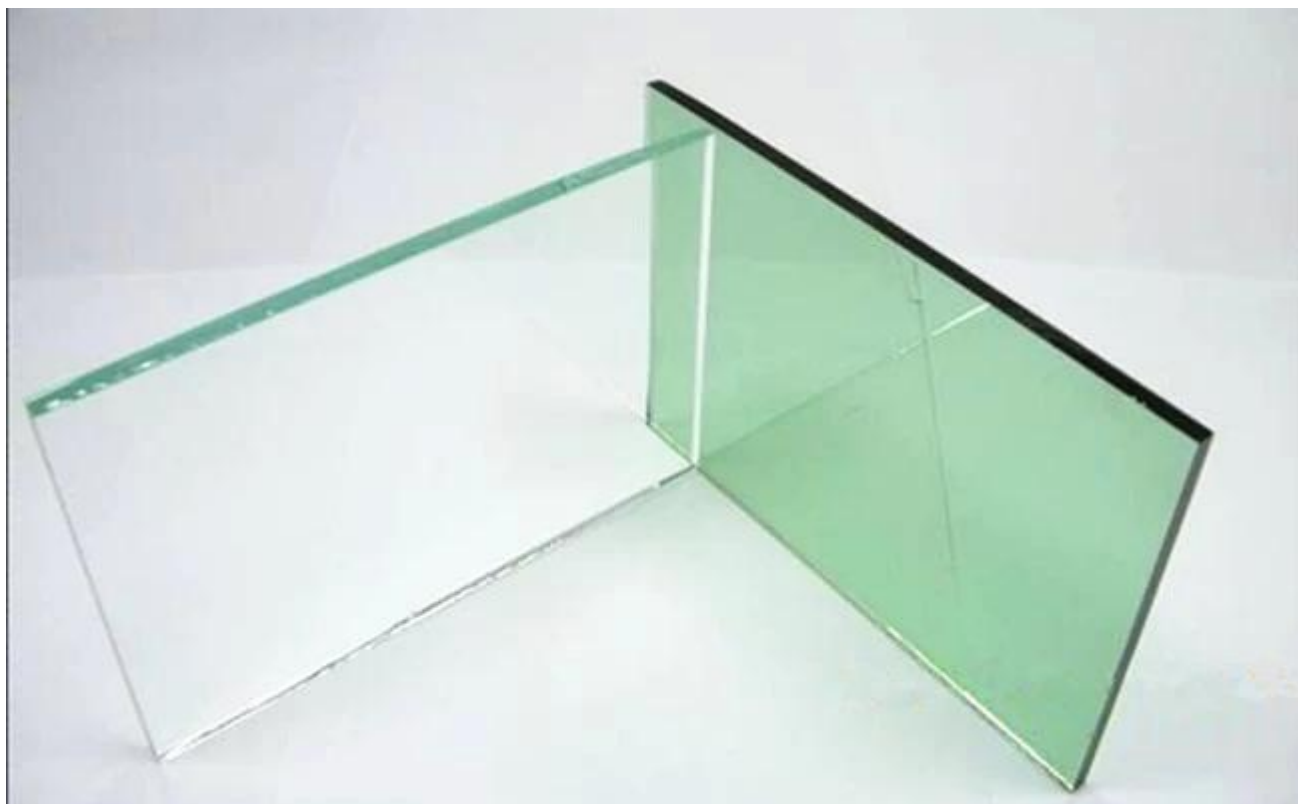
Bâtiment servant à trempé verre plat vert clair: