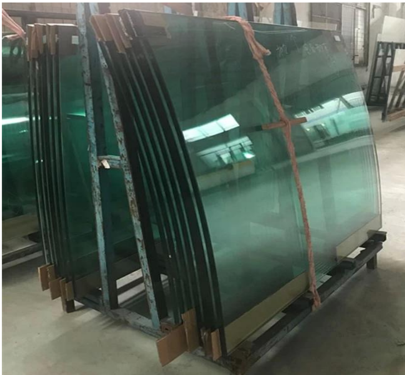
Ligne de Prouction de 19mm Chine en verre trempé courbé