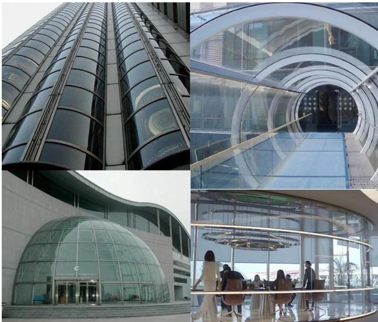
Image de verre trempé courbé de 19mm