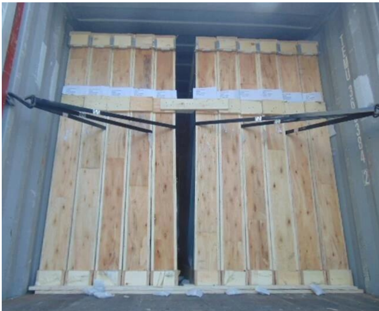
Verre flotté de faible teneur en fer pour serre