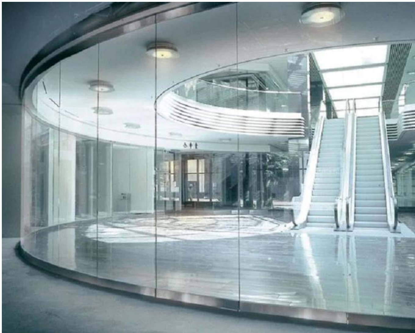
Cloison en verre trempé impression numérique de 12mm: