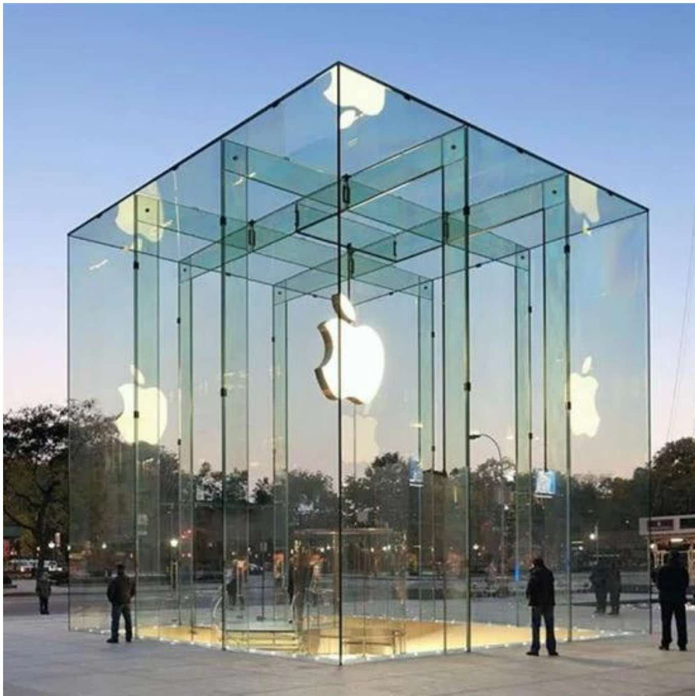
verre jumbo - Verre de loisir avec une hauteur de plus de 6 mètres.