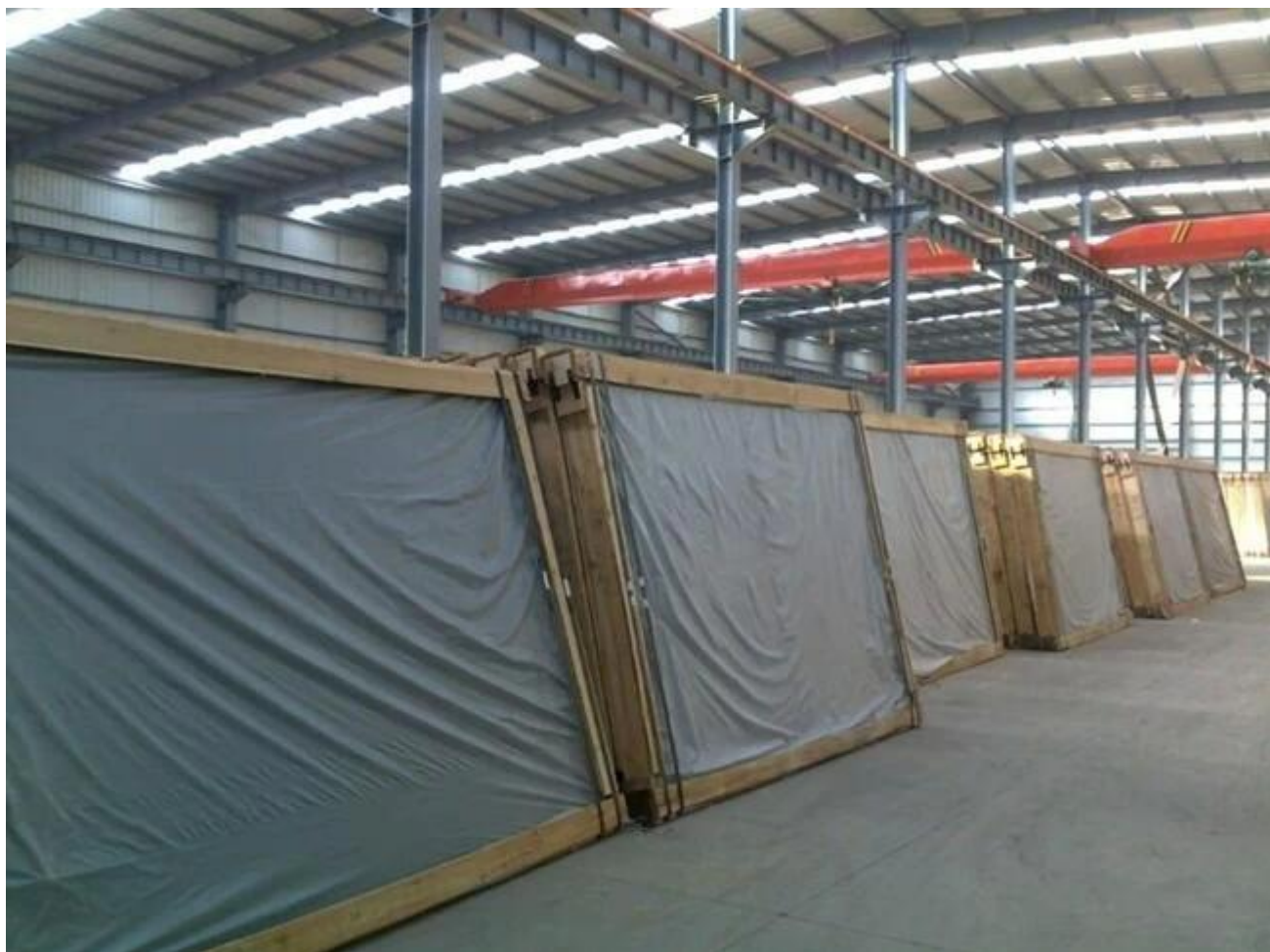
Verre stratifié JIMY Glass-Anneated en cours de chargement