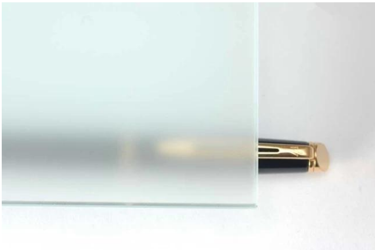
Production ligne de verre dépoli acide