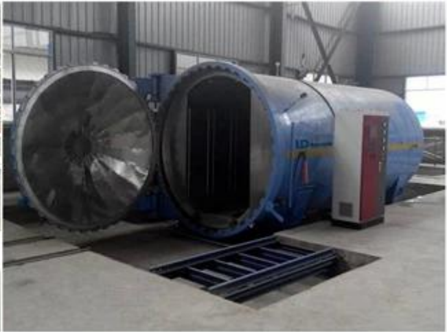
Figure 2: The storage and transportation of the composite material.