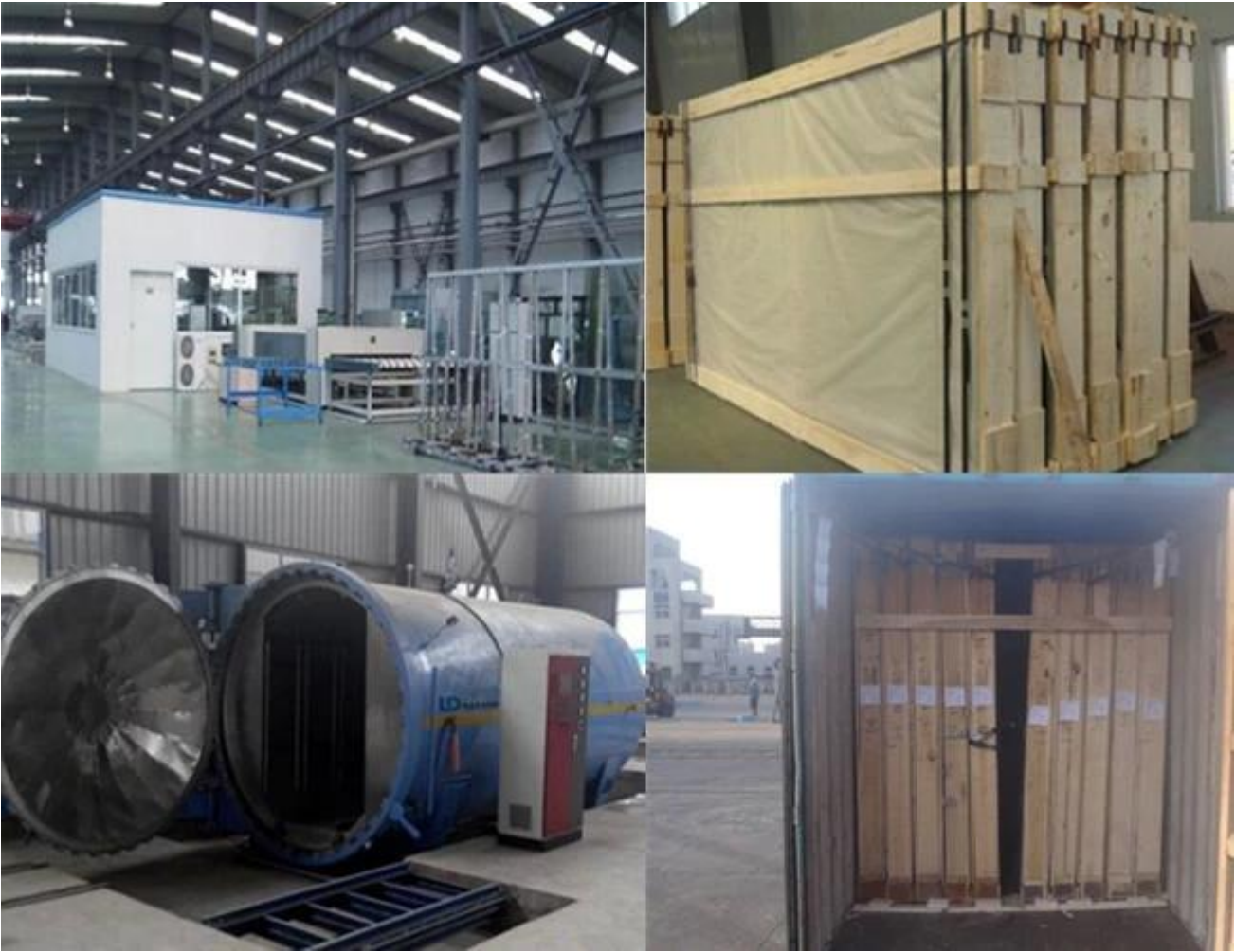
8.38 設備の梱包と輸送の様子