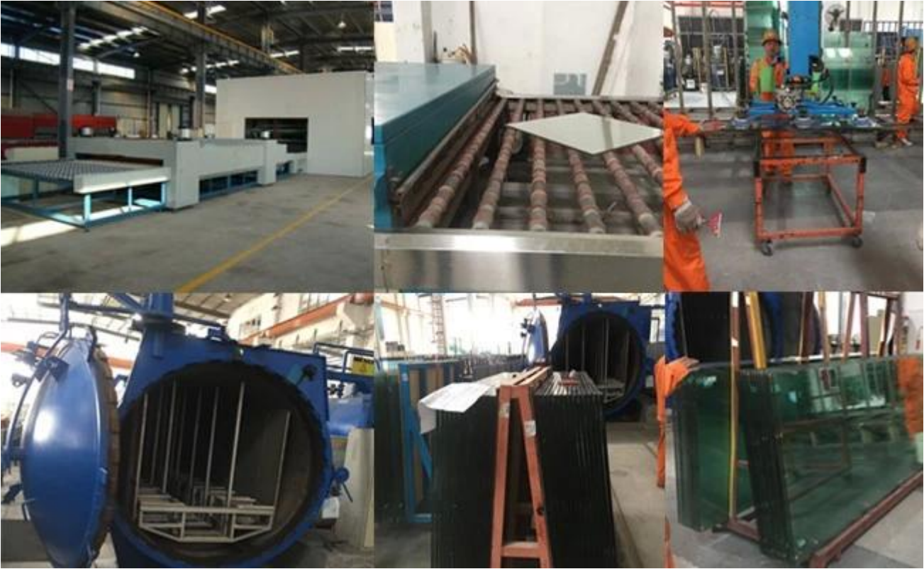
15 + 15 專業承接 各種玻璃 工程 設計 安裝 維修 保養 服務 週到