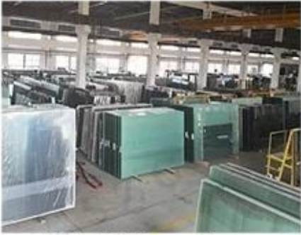
Material Storage Area