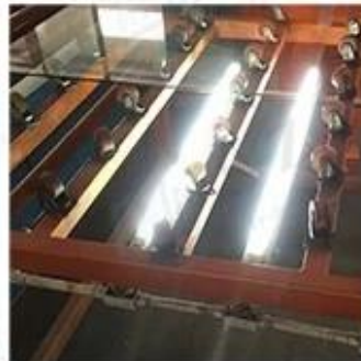
LED Lighting Detection