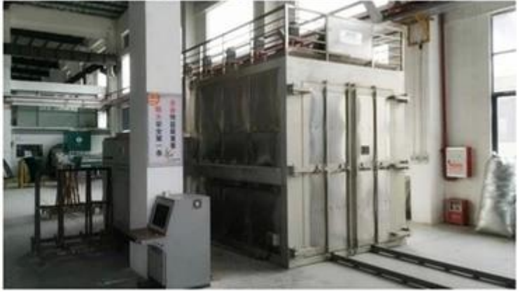
2. 玻璃板在玻璃厂内经过切割、磨边、钢化等工序，最后由叉车运送到仓库。