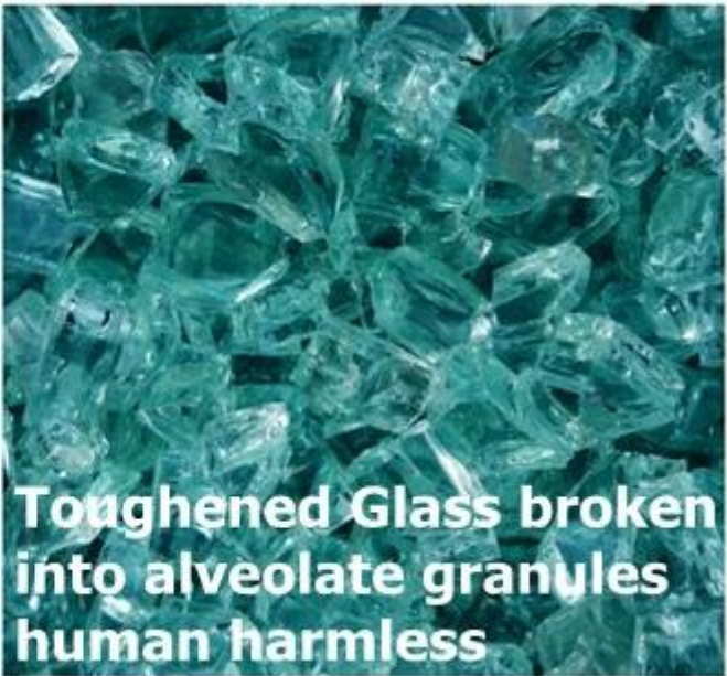
Toughened Glass broken into alveolate granules human harmless