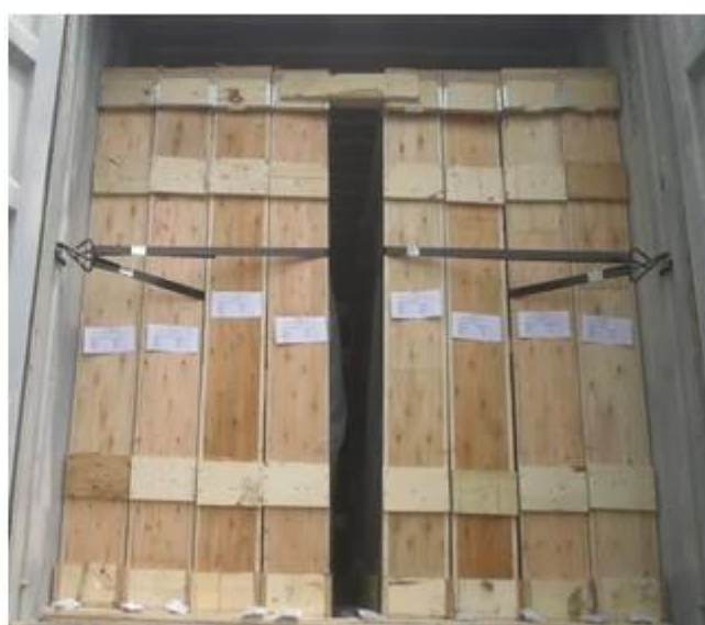
5.5mm ciemnoniebieski szkło barwione: