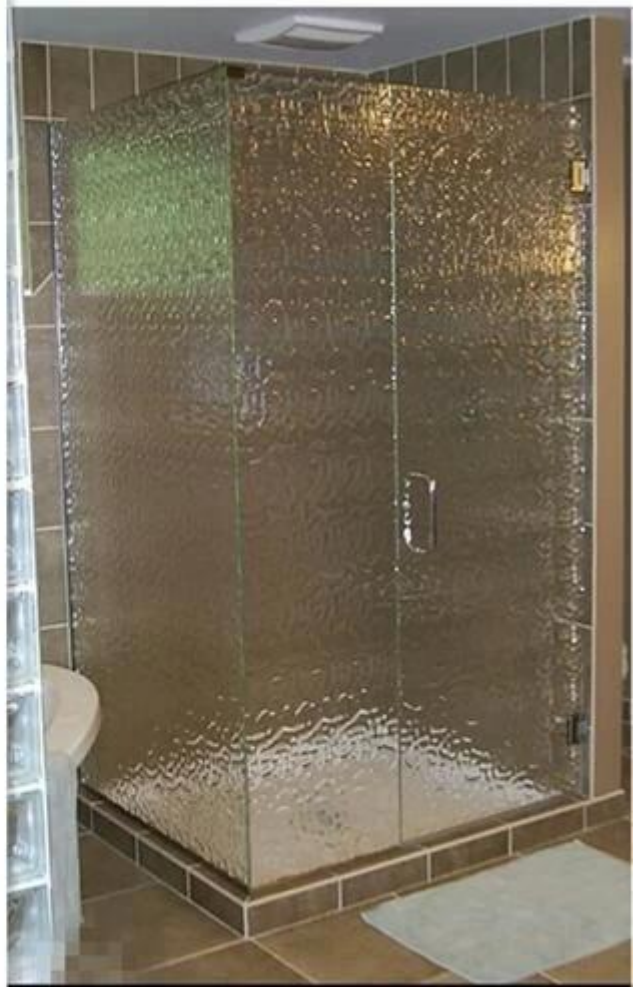
Wzorzyste szkło dla okna drzwi