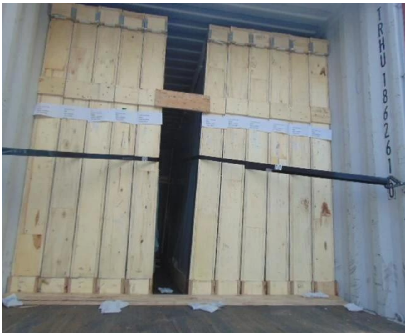
Aplikacje 5mm szkło lacobel szkło jimy