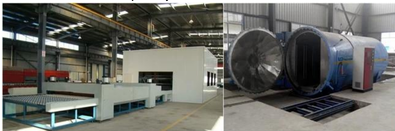
Hartowane szkło laminowane bezpieczeństwa, pakowania i załadunku