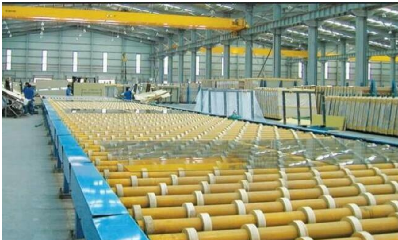
Chiny Float opakowania szklane