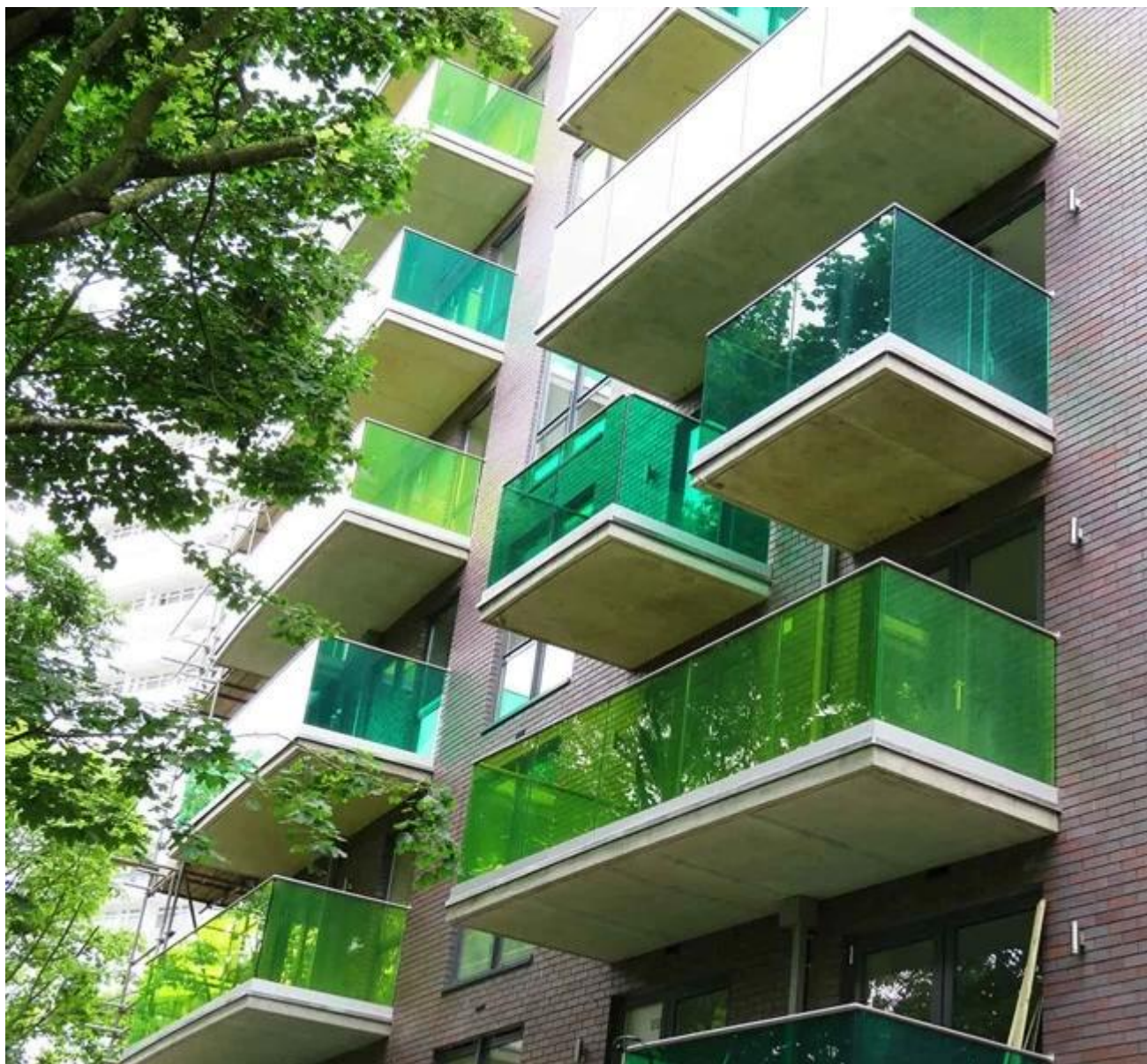
Przetwarzania, hartowane laminowane szkło z otworami i wycięciami