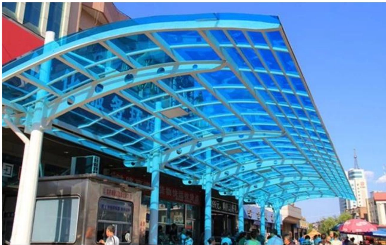
17.52mm zielony kolor hartowane szkło laminowane balkony