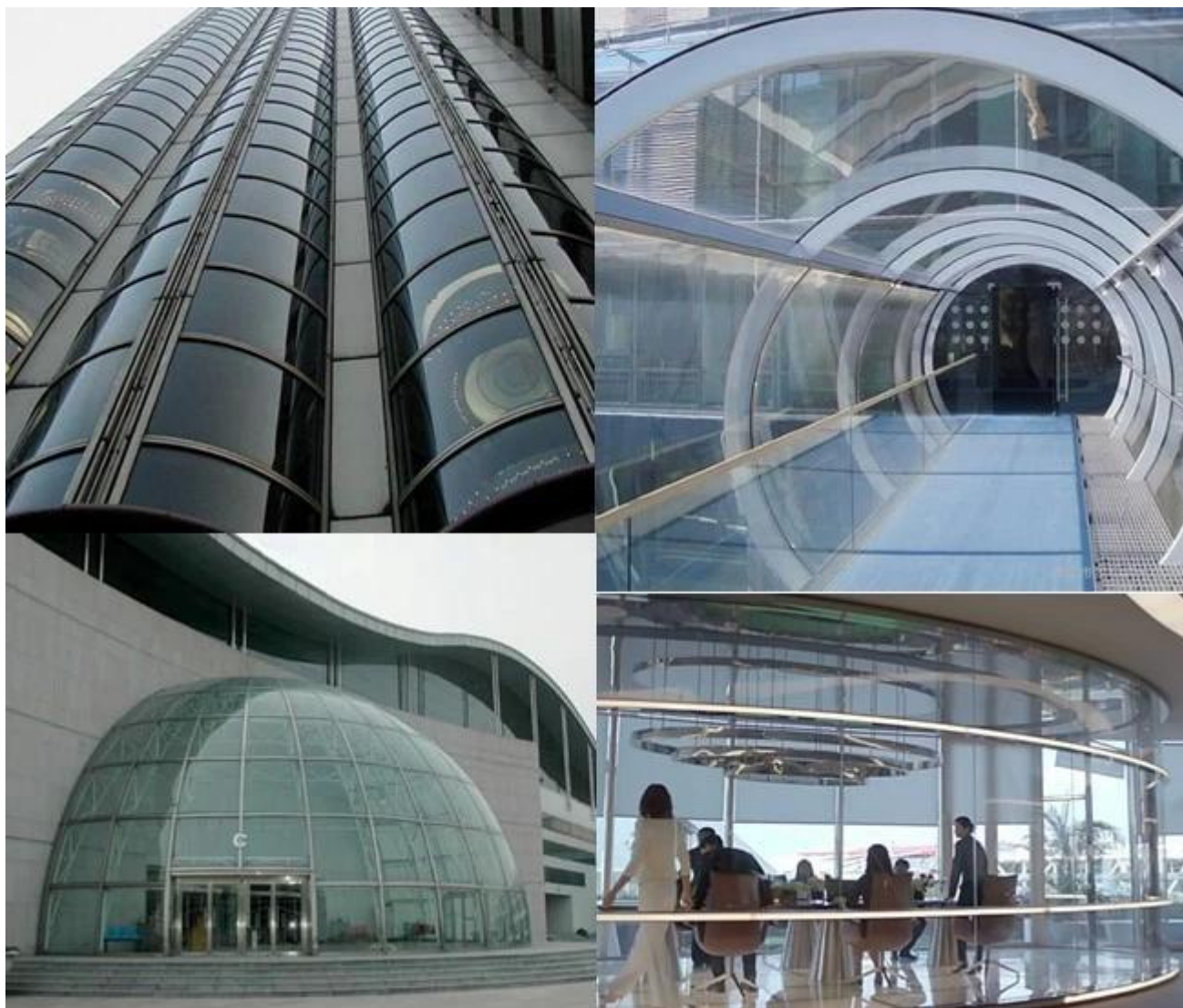
Obraz z zakrzywionego szkła hartowanego o grubości 19 mm