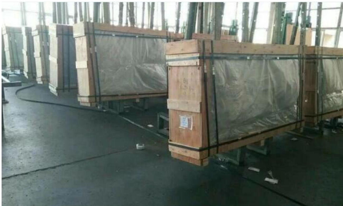
Załadunku kontenera przez fabryki szkła Jimy