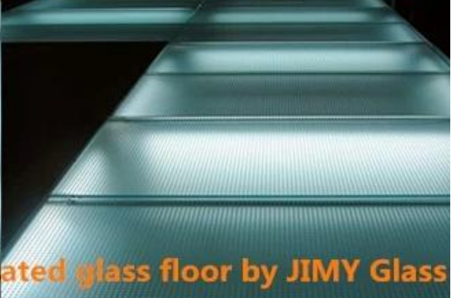
Anti-skid laminated glass floor by JIMY Glass