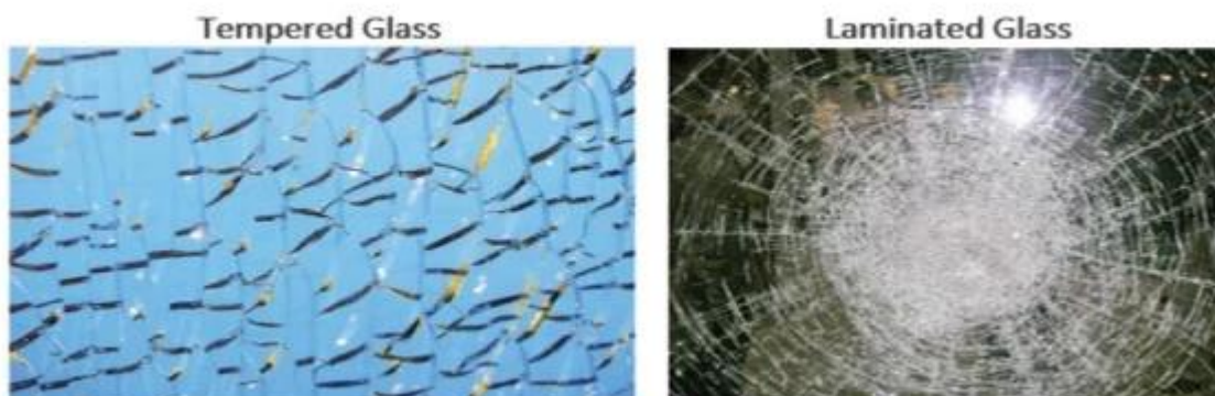
Laminated Glass Layers

Szkło laminowane to po prostu szklana kanapka. Wykonany jest z dwóch lub więcej warstw szkła z międzywarstwą winylową (PVB SGP, EVA) pomiędzy (przekładane, jeśli chcesz, jak w przedniej szybie samochodów). Szkło ma tendencję do pozostawania razem i przypadek, w którym jeden z nich jest zepsuty - co kwalifikuje się jako materiał do bezpiecznego oszklenia.