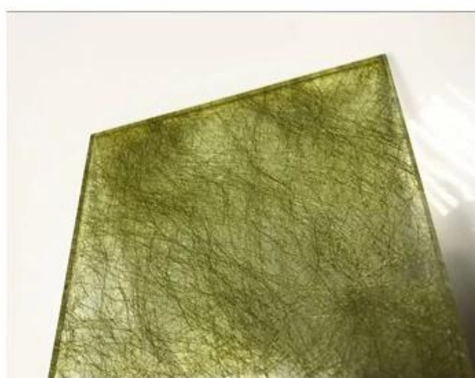
Szkło laminowane EVA: