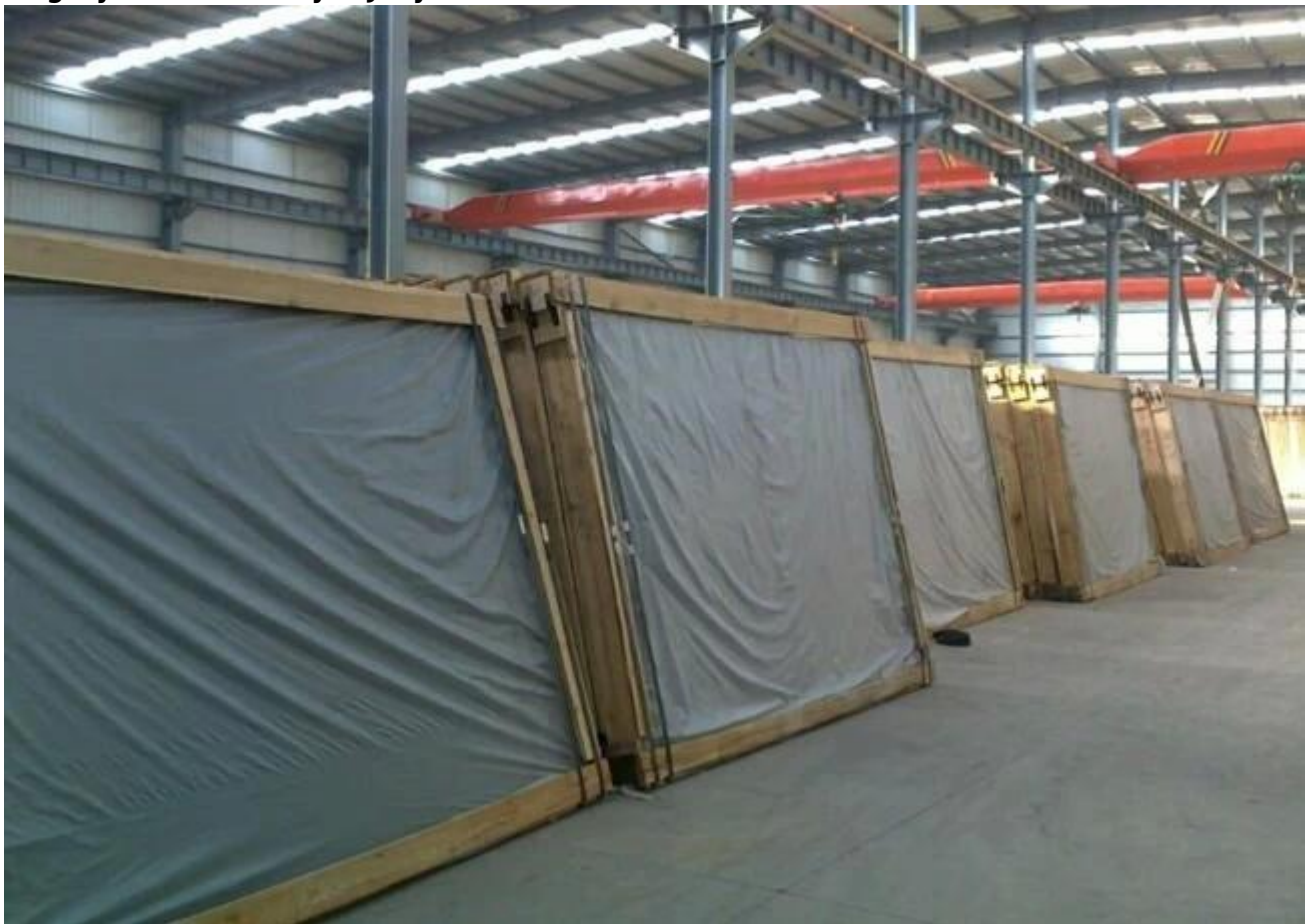
Przybliżyć szkło do załadowania