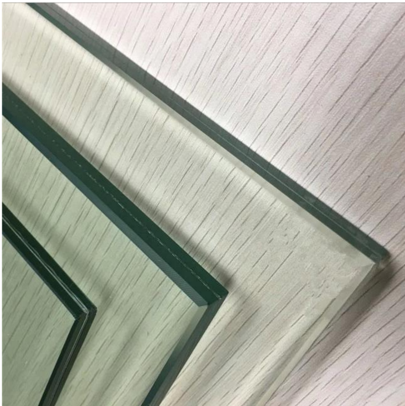
Vidro de segurança com recortes e furos