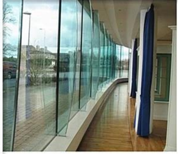
aleta de suporte de fachada de vidro laminado: