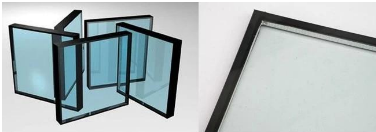
Foto da parede de cortina de vidro isolado de baixo-E temperada