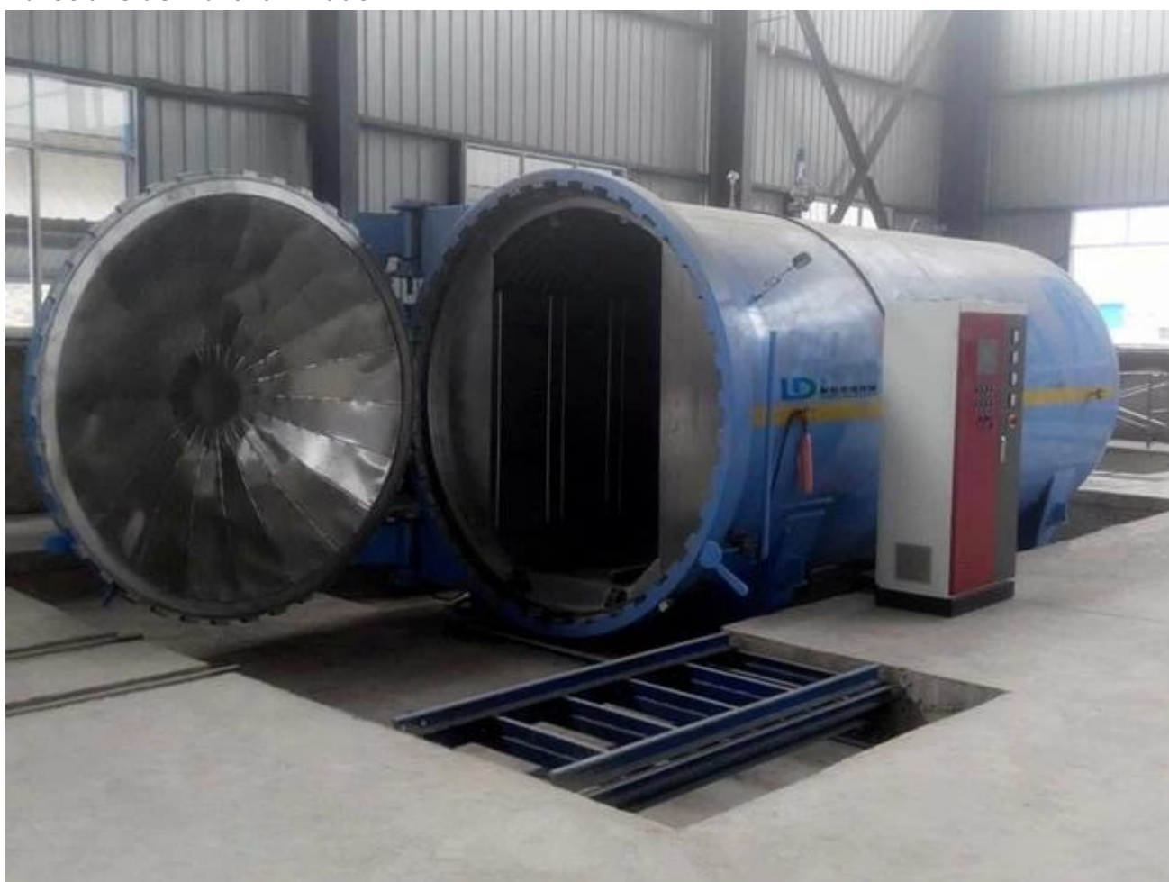
Embalagem da segurança do vidro laminado temperado