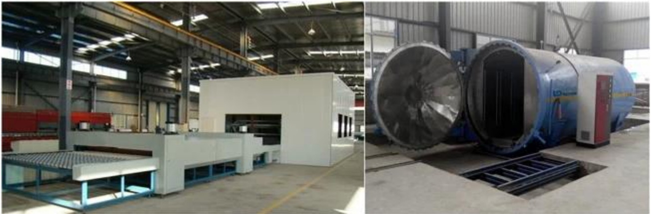
Temperado vidro laminado de segurança da embalagem e carregamento