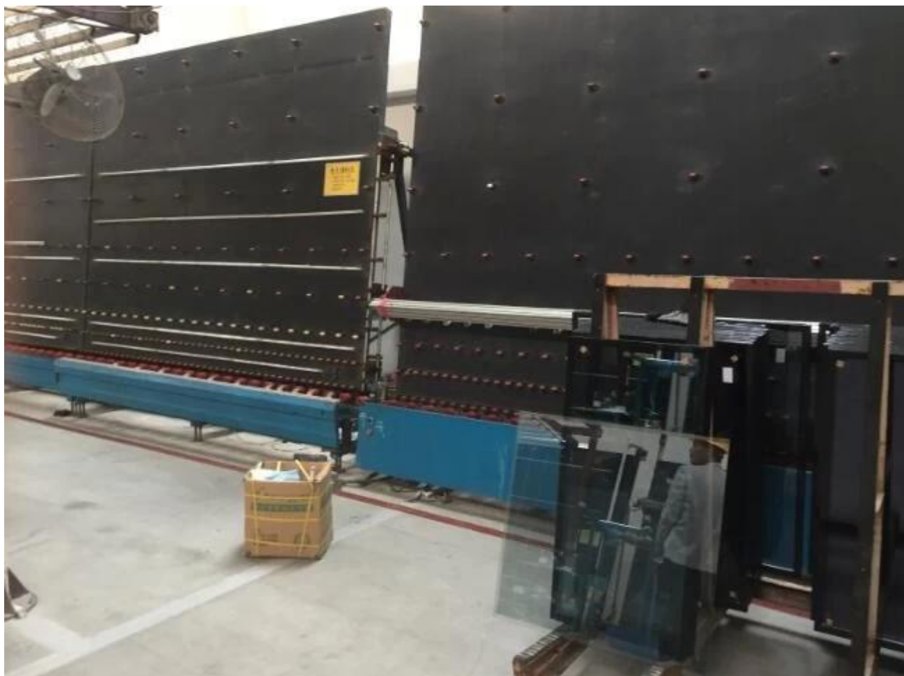
Armazém de vidro isolado pela fábrica de vidro de Jimmy